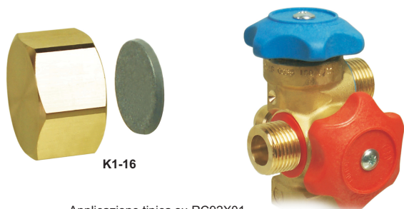
Applicazione tipica su RC92X01

Per installazione sulle Valvole delle bombole di gas refrigerante con capacità >10 Kg.