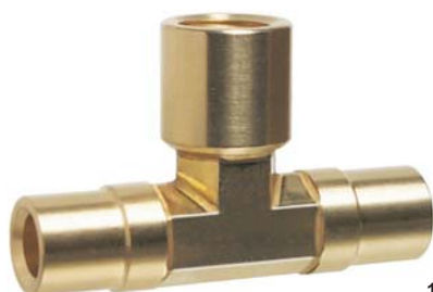
127- 4B 4

TEE - ODS a saldare x Femmina NPT x ODS a saldare Idonei per l'installazione di Tappi Fusibili di Sicurezza, Pressostati e Trasduttori elettronici di pressione.